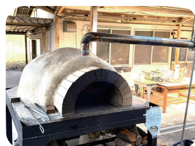
ピザ窯の完成です