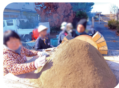
耐熱レンガを積みあげて ピザ窯を組み上げていきます