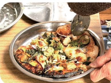
焼きたてピザは ふわふわもちもち♪