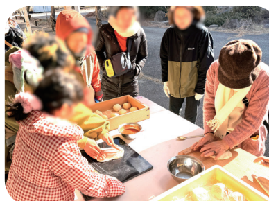
生地を伸ばし、 野菜やチーズをトッピングします

12月21日（日）に完成お披露目と火入れ式が行われました。御坂神社による安全祈願の神事後、参加者が協力して火入れを行い、会場は多くの人で賑わいました。1月11日（日）には、念願のピザ焼き体験を開催！！当日は市内外から老若男女約20名が参加し、参加者それぞれが生地を伸ばし、好みの具材をトッピングしてピザ窯で焼き上げました。ピザ窯で焼いたピザは生地がふっくらと膨らみ、ふわもちの食感と野菜の美味しさを存分に味わうことができました。生地やトッピングの野菜には、地元志染の食材が使用されました。今後もこのピザ窯を活用し、食を通じた食育体験や交流の場づくり、地域の魅力発信につながる活動を進めていけます。