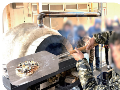
ピザが焼きあがると 歓声があがりました