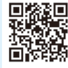
▲福祉機器貸出事業の詳細