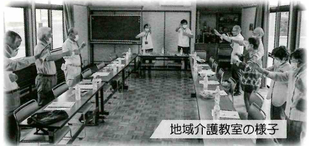
地域介護教室の様子

介護を必要とされる方が、自宅で適切にサービスを利用できるように、介護支援専門員（ケアマネジャー）がケアプランや予防プランの作成をします。また、介護認定の申請や更新手続きの代行もしています。