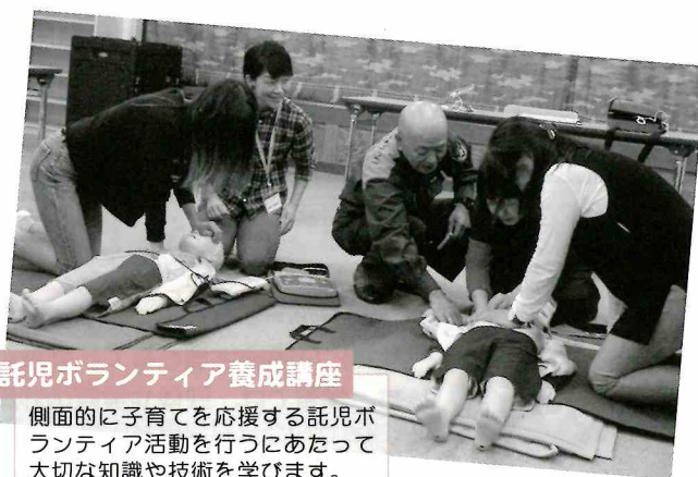
託児ボランティア養成講座

側面的に子育てを応援する託児ボランティア活動を行うにあたって大切な知識や技術を学びます。