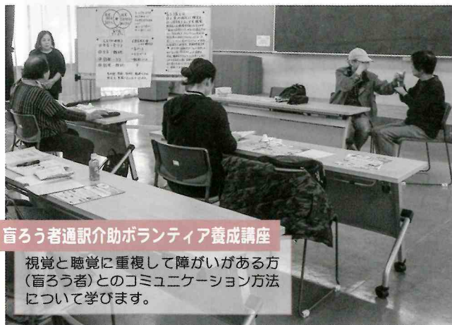
盲ろう者通訳介助ボランティア養成講座

側面的に子育てを応援する託児ボランティア活動を行うにあたって大切な知識や技術を学びます。