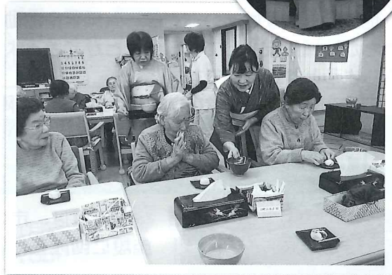
2/14 公民館の茶道教室のみなさんとお茶会 (口吉川)

市内8か所のデイサービスセンターでは、季節にちなんだ催しを行っています。2月は節分やお茶会などを楽しみました。