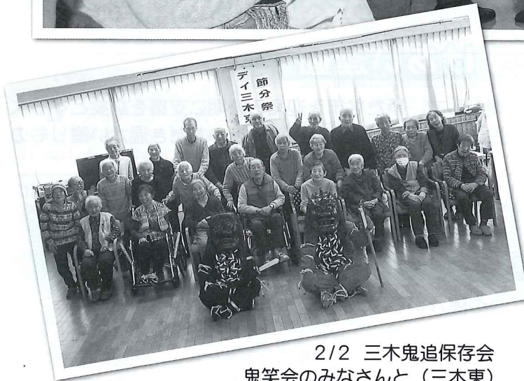
2/2 三木鬼追保存会 鬼笑会のみなさんと (三木東)