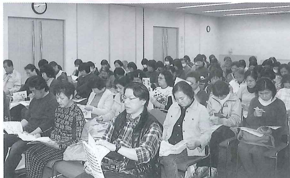
当日は、講師として三木市中央地域包括支援センター吉川サブセンターと、さざんかの郷在宅介護支援センター兼居宅介護支援事業所の職員に来ていただきました。