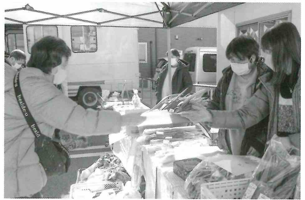
歳末たすけあい募金の助成金を活用した地域住民との交流

その他の配分先の事務所でも、それぞれの趣向をこらしたクリスマス会や餅つき大会を地域と交流し開催しています。施設利用者と地域住民が様々なゲームや行事を一緒に楽しみながら、お互いのつながりを深めているきっかけの1つとなっています。