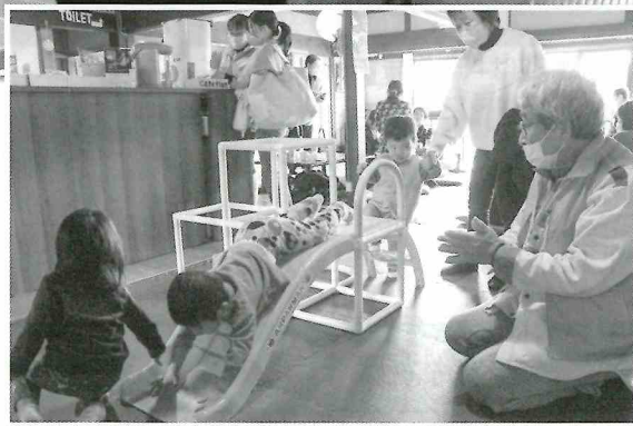
子どもたちと一緒に遊ぶ協力会員

先輩ママの子育て体験を聞いたり、相談をしたり、ゆるやかに温かい空気に包まれた交流会となりました。