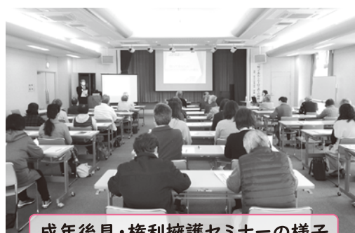
成年後見・権利擁護セミナーの様子