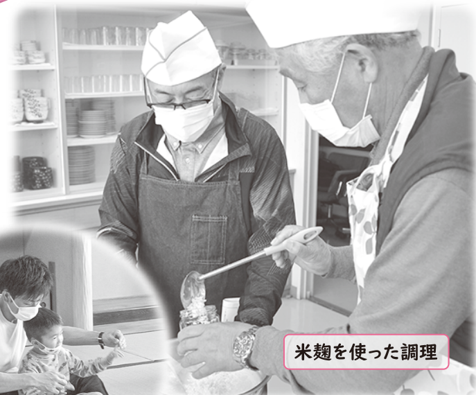
米麴を使った調理