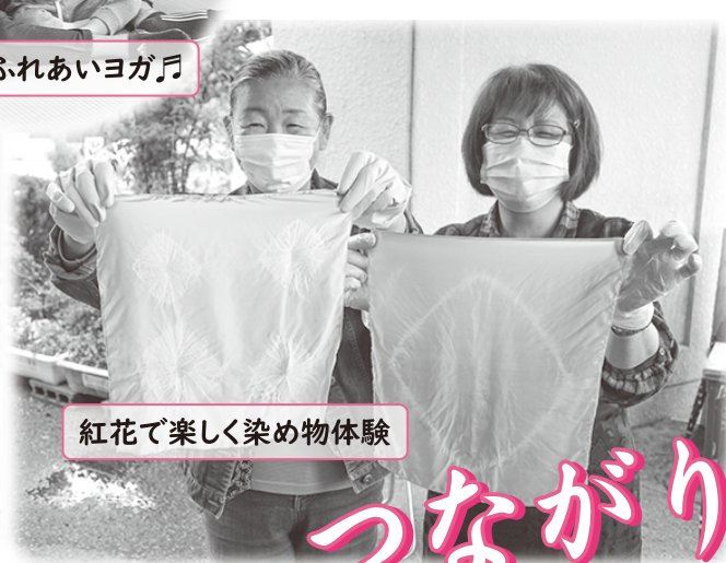
紅花で楽しく染め物体験