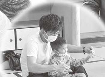
親子ふれあいヨガ